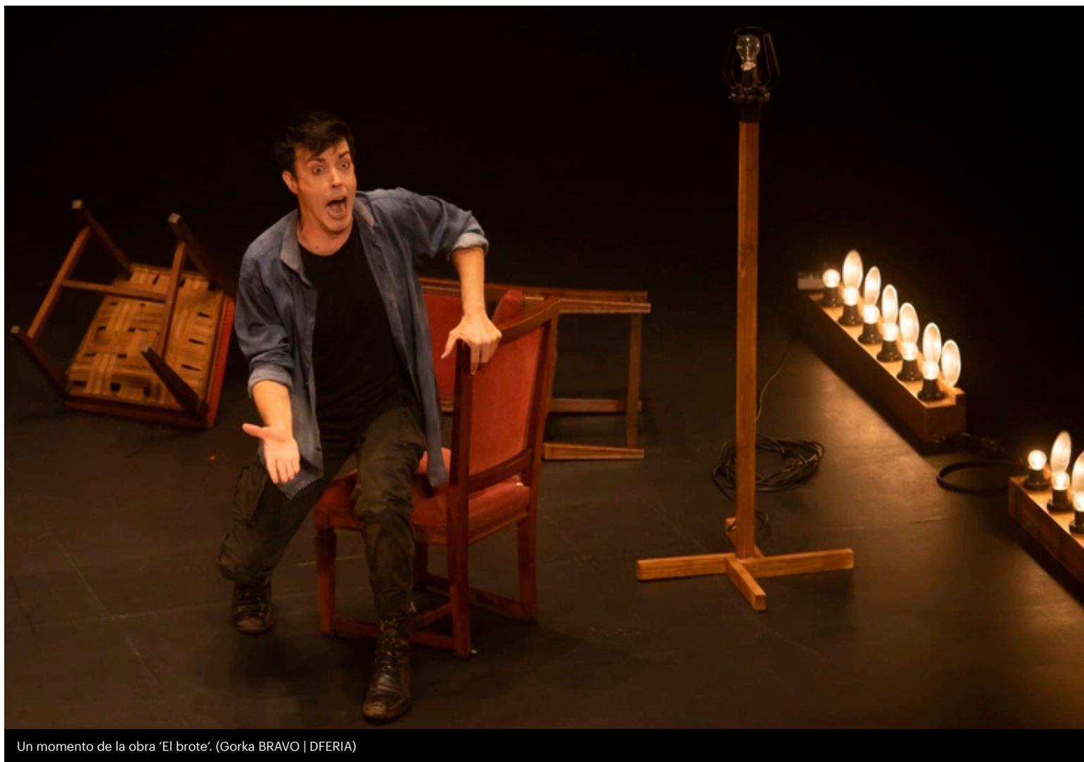
Un momento de la obra 'El brote'.

Las anécdotas que los cómicos y cómicas con largos años de vida profesional cuentan en estados de descompresión son infinitas. Serían compendios de tocs de toda índole. Leyendas, falsas mitologías, situaciones imposibles de repetir sin entrar en fase delirante. En esta obra tenemos a un actor que describe su situación en una compañía, en un montaje, sus relaciones con los compañeros a base de descripciones de esas características personales que hacen de la convivencia en escena, y antes y después, parte sustancial de una vida condensada en ese periodo de tiempo.