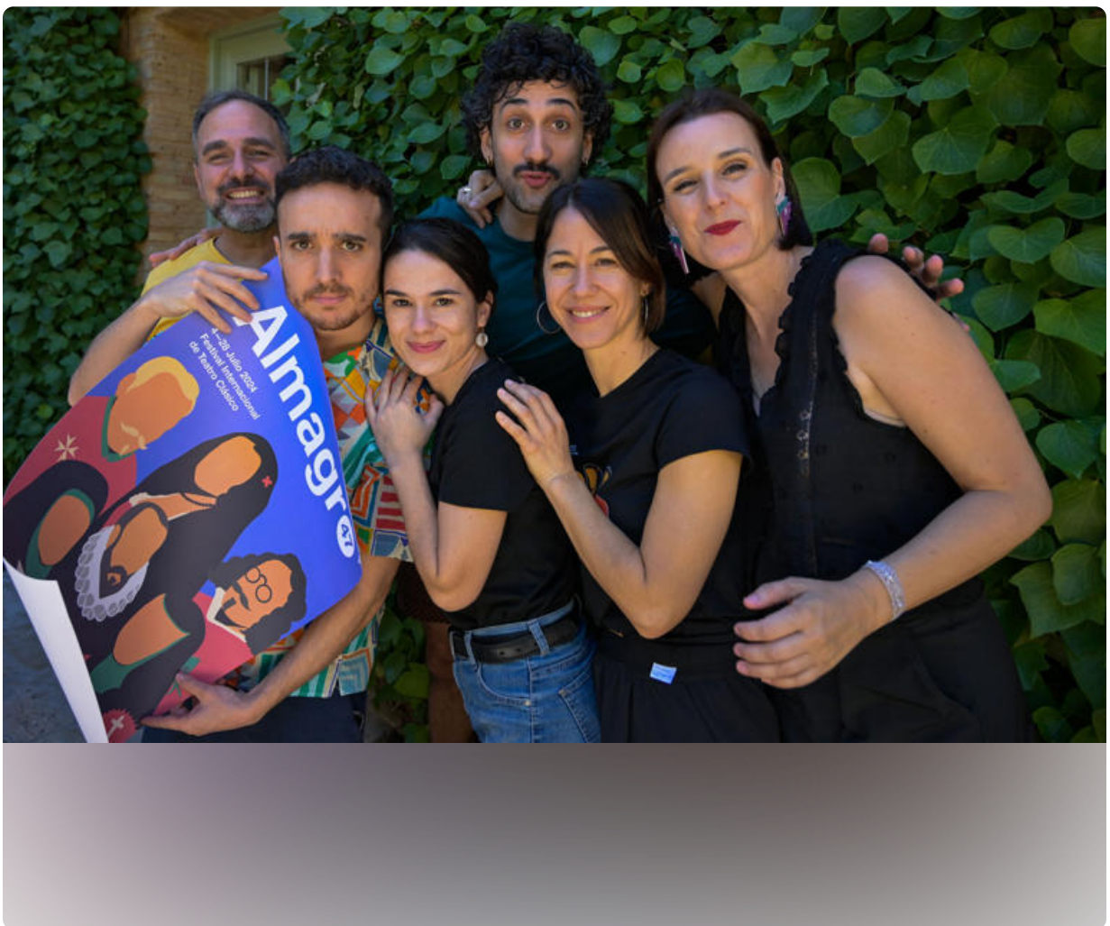
La compañía argentina Criolla, premiada en el Festival de Teatro Clásico de Almagro

Historia de Agencia EFE • 4 día(s) • ⌚ 2 minutos de lectura